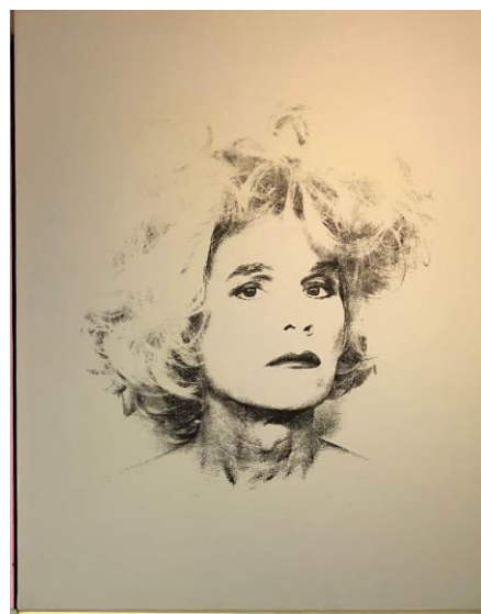
Seychelles – 1990 (165 x 135)