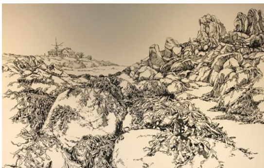
Œuvre à l'encre sur toile

Un patronyme familier du bocage Virois, des pontons Granvillais et de Vains-Saint Léonard... et un prénom qui résonne sur toute la Normandie artistique. Seront présentés des encres sur papier et des tirages photos de dessins à l'encre.